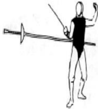
Gbr. 2. Bidang sasaran jenis senjata floret

Bentuk irisannya segi empat, lentur dan ringan, ujungnya datar dan bulat tumpul dan berpegas. Pelindung tangan ( kom ) kecil cukup untuk melindungi bagian tangan saja. Jenis senjata ini digunakan untuk menusuk dengan bagian pangkal senjata untuk menangkis dan menekan. Bidang sasaran adalah pada bagian togok yaitu dari pangkal paha ke atas sampai pangkal tangan dan leher. Panjang senjata = 110 cm, berat = 500 gram.