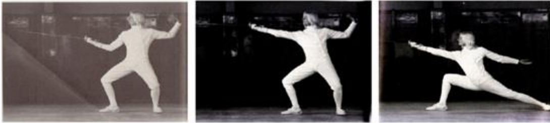
Gbr. 4. Gerak serang dalam anggar

oleh suatu gerak meluruskan lengan tangan yang memegang pedang, yang menjangkau dengan ujung pedang untuk mengarahkan dan menusuk lawan pada area target. Bersamaan waktu dengan tangan yang memegang pedang, kaki dilontarkan menjangkau lurus kedepan dalam mencapai gerak penuh, dengan tumit sepatu kaki depan mendarat ke tanah terlebih dahulu yang akhirnya akan jatuh dalam posisi serangan penuh.