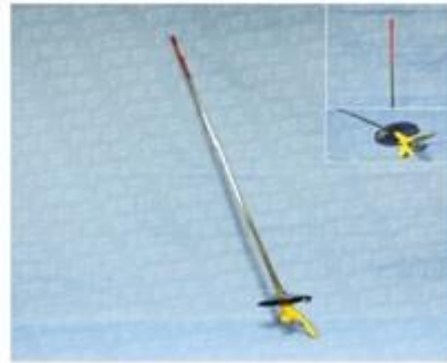
Gbr.3. Senjata Floret (FOIL)